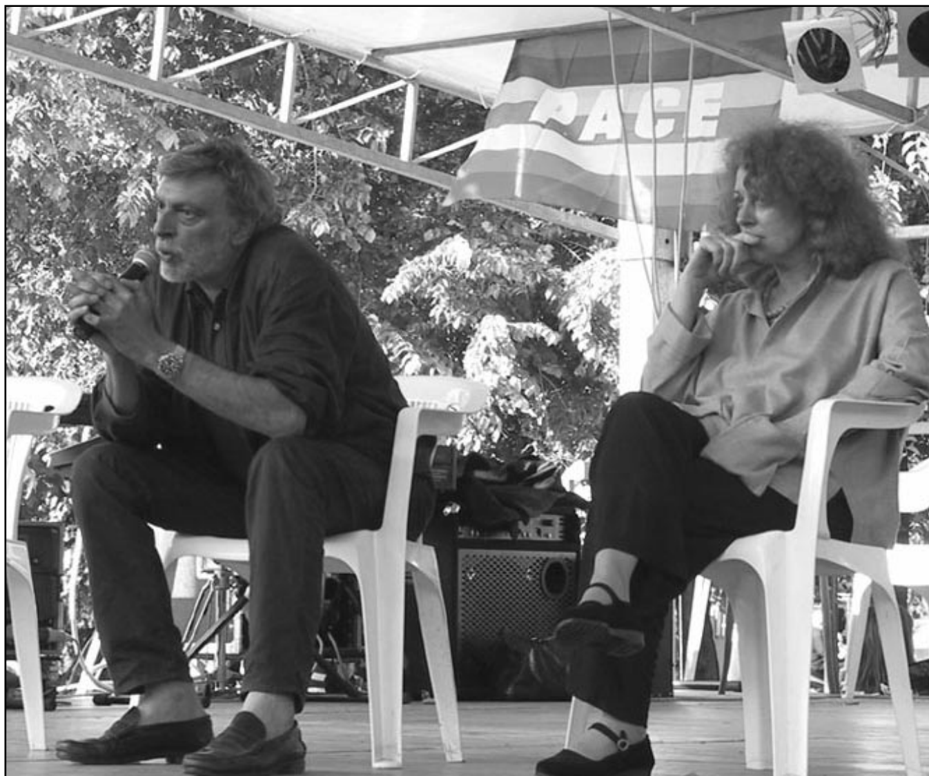
Caserta - Gino Strada e Teresa Sarti al IV Meeting dei giovani

Domanda: Emergency compie dieci anni in questi giorni. Dai primi ospedali in Iraq, dalle prime missioni in Ruanda, sono trascorsi dieci anni. Quanto è cambiata Emergency? E Gino Strada mantiene la stessa voglia di stare in prima linea? Risposta: La mia voglia è la stessa, solo con dieci anni di più. Emergency è, invece, cresciuta; è diventata più grande e più complesso ed articolato il suo intervento. D. Quindi, Emergency ha oggi maggiore visibilità e più potere? R. Non userei il termine potere, ma parlerei di visibilità. Emergency è un'ONG (Organizzazione non Governativa) credibile perché è attiva a livello internazionale, pratica la solidarietà e, credo, che in questi dieci anni, in tutti noi, abbia contribuito a far crescere le coscienze, anche culturalmente, sulle questioni centrali relative alla guerra e alla pace. Emergency è cambiata anche perché ha scelto di schierarsi in modo aperto e irreversibile dalla parte dei diritti umani.